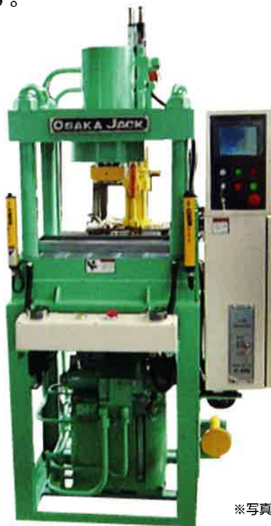
※写真は実機と異なります

高圧ポンプを使用することによりコンパクトでハイパワーの油圧プレスとなっております。 インバータを標準装備しており、アイドルストップによる省エネに貢献出来る他、速度調整が可能となっております。