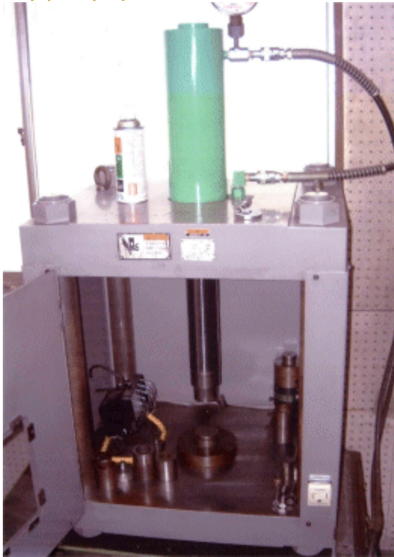
ヘッダーダイスプレス50TON